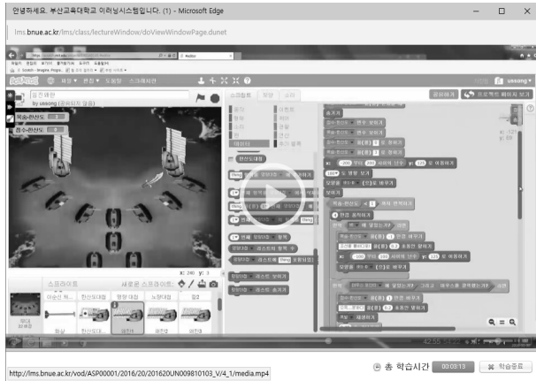
Fig. 3. A Lecture Screen of the Online Class

SW교육을 위한 수업의 내용은 Table 1과 같이 연구자가 예비교사인 학습자가 교육현장에서도 활용할 수 있는 과제들 중심으로 구성된 교육프로그램에 따라 12주 총 24시간 동안 진행되었다. 예비교사의 SW교육을 위해 개발한 교육 프로그램은 문제기반 학습(problem-based learning)과 프로젝트 기반 학습(project-based learning)이 이루어지도록 구성하였다. 문제 기반과 프로젝트 기반 학습은 실세계와 관련된 문제나 프로젝트의 해결 과정을 통해 학습자의 능동적인 참여를 유도하고 학습자가 교육내용을 자기 주도적으로 학습할 수 있도록 유도하는 교육방법으로 프로그래밍 교육에서 자주 이용된다[20, 21]. 8주차까지는 교육내용을 대학생 수준에 알맞게 구성하여 개인별 문제 기반 학습이 이루어지도록 하였다. 스크래치의 기능, 프로그래밍 개념 및 학습 방법에 대해 이해할 수 있도록 다양한 프로그램들을 학생이 제작하도록 교육하였다. 이후 12주차까지는 학습자들을 소규모 그룹으로 나누고 개별 그룹들이 교육용으로 활용할 수 있는 주제의 프로젝트를 스스로 계획하고 제작한 후 발표하도록 하였다.