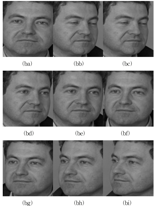
Fig. 3. Sample images from FERET database with varying pose from 0, 60, 40, 25, 15, -15, -25, -40, -60 in order

SIFT 알고리즘 성능을 위하여 본 연구에서는 영상의 크기를 240×240화소, 최근접 이웃점과의 비율을 0.8로 지정하였다. Table 1에는 FERET 데이터베이스 영상을 인식하는 결과를 비교 정리하였다. Table 1의 ASIFT1은 Morel과 Yu[17]가 사용한 원래의 ASIFT 알고리즘이며, 기울기 숫자를 5로 지정하여 5개의 변환각에 대한 이미지를 생성한 경우이다. ASIFT2는 본 연구에서 제안한 방법으로 수직 및 수평 방향의 변환각을 무의미한 범위에서는 제한한 알고리즘이며 정량적인 비교를 위하여 정면 영상에서 동일하게 5