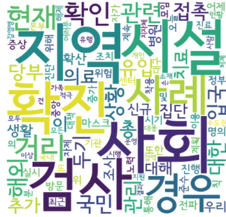
Fig. 1. Domain of Dataset

본 데이터의 특성은 세 가지로 볼 수 있다. 첫째, 총 11,402개의 문장에 대한 수어 영상 및 문장에 대한 데이터를 수집하여 기존 한국어-수어 데이터셋에서는 존재하지 않던