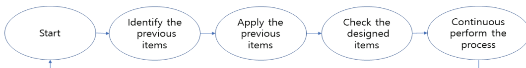
Fig. 1. Process of DCI

DCI에서 결함의 원인을 찾아서 제거하기 위해서는 결함여부에 대한 판단 기준이 필요하다. 결함의 판단 기준은 결함의 정도를 파악하기 위한 것으로서 다음과 같이 제시한다.