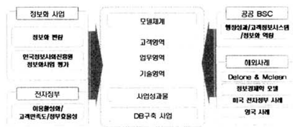
(그림 1) 행정정보DB구축사업 성과관리모델 체계