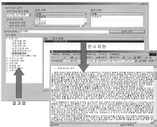
(그림 3) 검색결과 분류

(그림 3)에서는 '김대중'이라는 질의어를 입력하여 왼쪽 창 결과맵 중에서 논문에서는 2건, 사실칼럼에서는 36건, 큐엔에이에서는 1건이 매칭되어 나온 결과를 보여주고 있으며 논문 장르의 인문사회 주제범주에서 걸린 1건의 문서를 클릭하여 브라우저된 모습을 나타내고 있다.